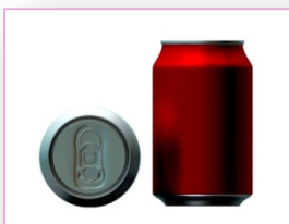
- Envases de Aluminio.