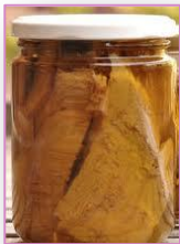
- Escabechados, adobados.