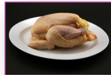
- Carnes de aves.