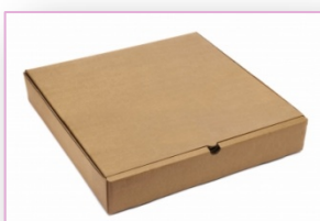
- Envases de Papel y cartón.