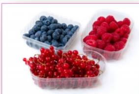
- Envases de Plástico.

Existen varios tipos de envases que se clasifican en función del material en: