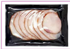
- Envasados al vacío.