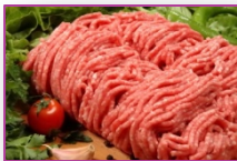
- Carne picada.

Los siguientes alimentos son los que se contaminan con mayor facilidad, por ello hay que extremar la precaución cuando se manipulan y almacenan.