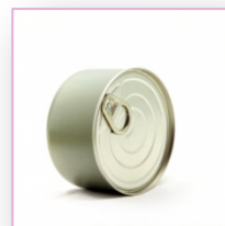
- Envases de Hojalata.