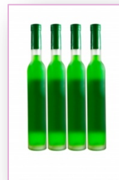
- Envases de Vidrio.