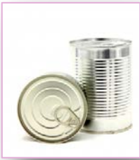
- En conserva.

Se pueden conservar a temperatura ambiente los productos que estén: